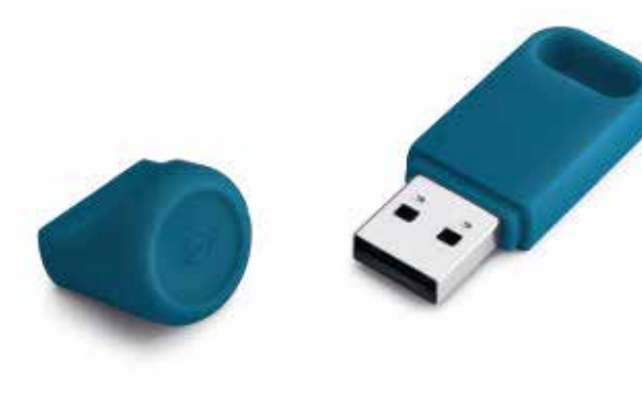
MINI USB KEY.

Capacidad: 32 Gb Número de parte (grey): 80 29 2445703 Número de parte: 80 29 2460899-98