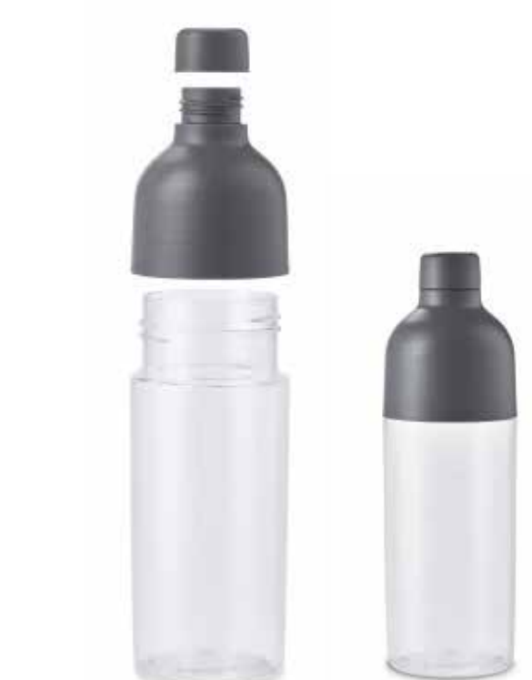
MINI COLOUR BLOCK WATER BOTTLE.