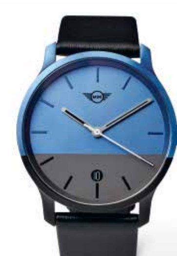
MINI COLOUR BLOCK WATCH.