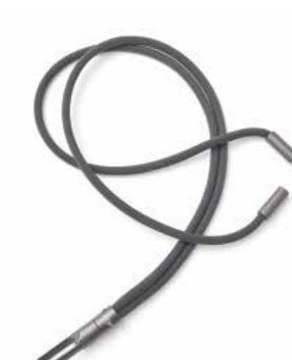
MINI TUBE LANYARD.