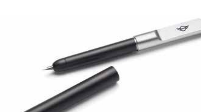
MINI FOUNTAIN PEN.