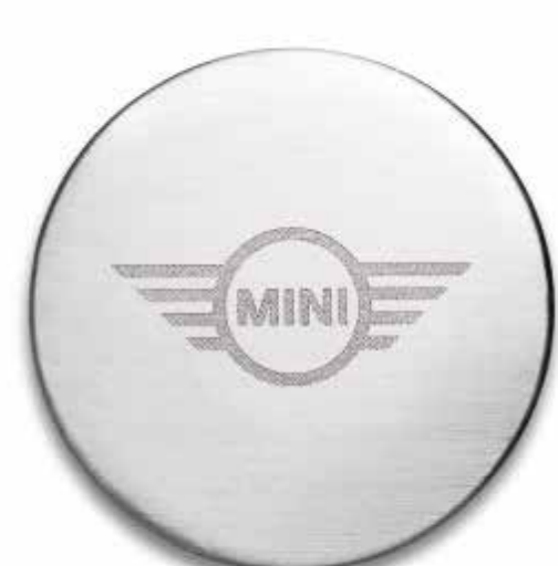
MINI WING LOGO MAGNET.