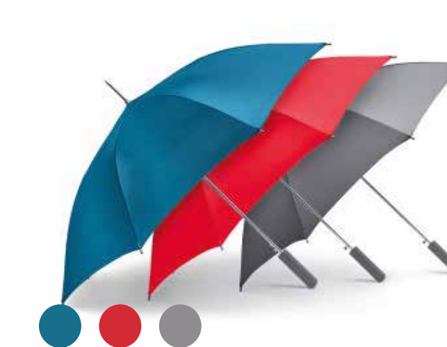
MINI WALKING STICK SIGNET UMBRELLA.

Número de parte: 80 23 2460889-90 Número de parte (grey): 80 23 2445719