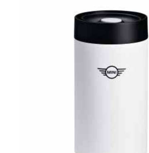
MINI TRAVEL MUG.

Número de parte (white): 80 28 2445702 Número de parte: 80 28 2460909-10