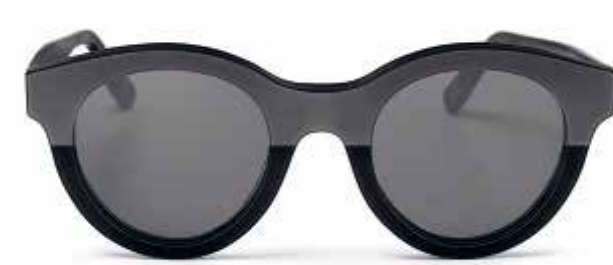
MINI MATT/SHINE PANTO SUNGLASSES.

Número de parte: 80 23 2460892-91 Número de parte: 80 23 2445722