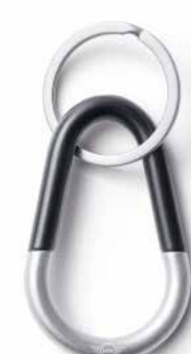
MINI COLOUR BLOCK KEYRING.