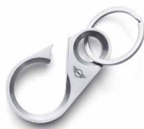
MINI BOTTLE OPENER KEYRING.