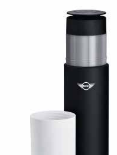
MINI TRAVEL FLASK.

Número de parte (white): 80 28 2445702 Número de parte: 80 28 2460909-10