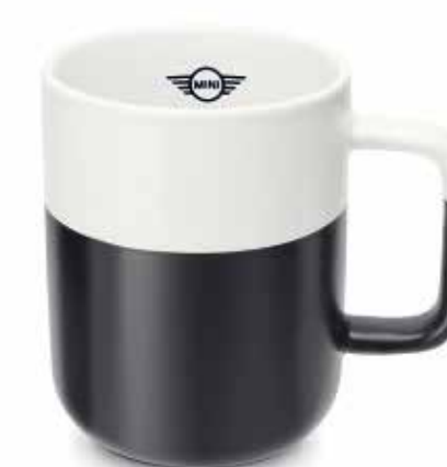
MINI COLOUR DIP CUP.