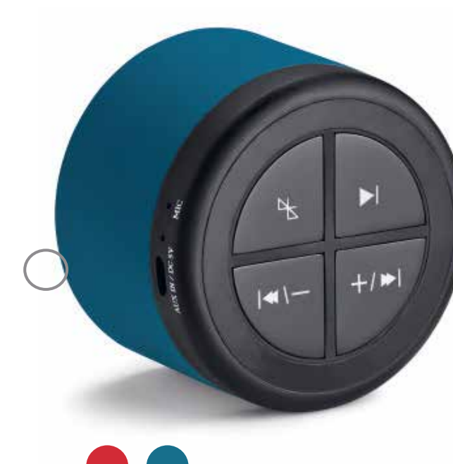
MINI BLUETOOTH SPEAKER.

Número de parte: 80 21 2460921 iPhone 7/8 Número de parte: 80 21 2460922 iPhone 7/8 Plus Número de parte: 80 21 2445709 Samsung Galaxy 7