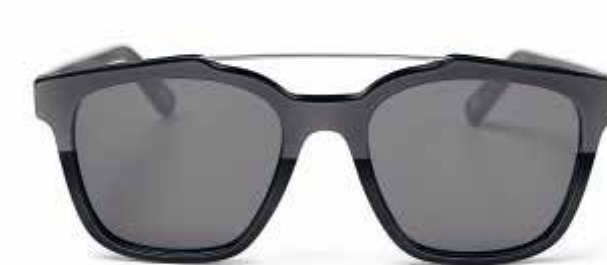
MINI MATT/SHINE AVIATOR SUNGLASSES.