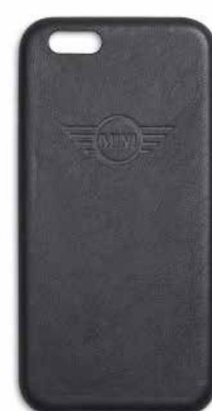
MINI PHONE COVER.

Número de parte: 80 21 2460921 iPhone 7/8 Número de parte: 80 21 2460922 iPhone 7/8 Plus Número de parte: 80 21 2445709 Samsung Galaxy 7