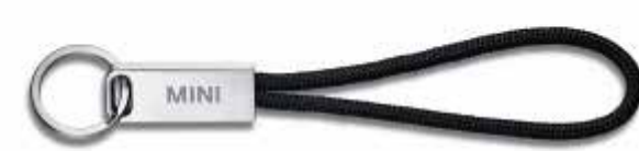
MINI WORDMARK KEYRING.