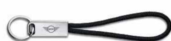
MINI WING LOGO KEYRING.